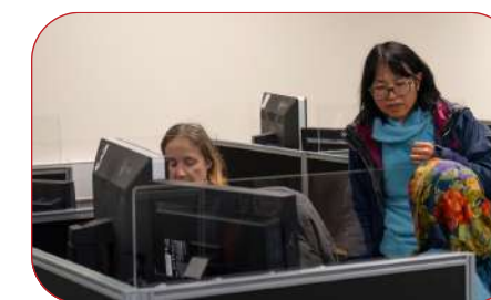
DIWRNOD ASTUDIO ONCOLEG - RHAGFYR 2024