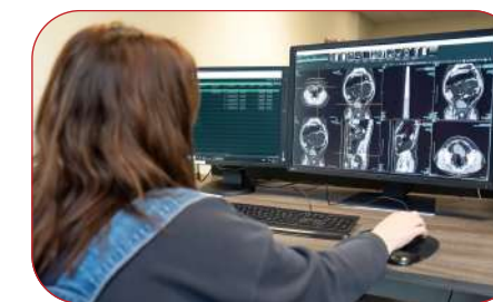
CWRS COLONOSGOPI CT - HYDREF 2024