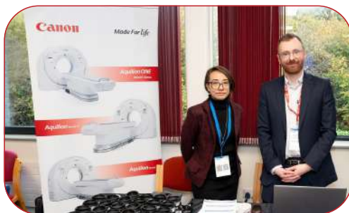
CANON MEDICAL LIMITED