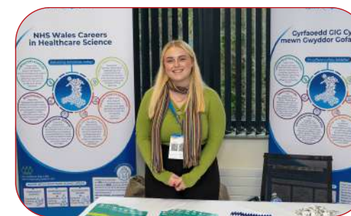
HEALTHCARE SCIENCE CYMRU