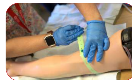
CWRS CANWLEIDDIO - MEDI 2024