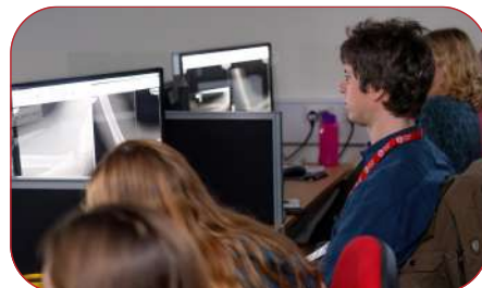
CWRS MEDDYGAETH FRYS - CHWEFROR, EBRILL, AWST A RHAGFYR 2024