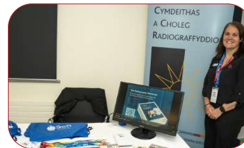
SOCIETY OF RADIOGRAPHERS